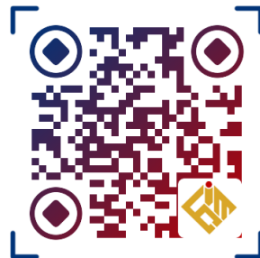
[扫码登录] FIMC官方网站

如对金融投资管理挑战赛有任何疑问和建议，欢迎通过组委会邮箱或官方赛事群与我们联系。