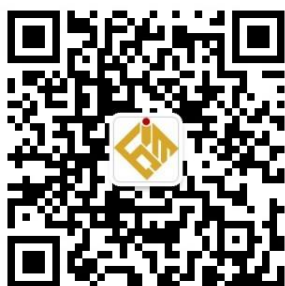
[扫码关注] FIMC金投赛订阅号